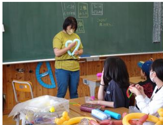
バルーンアートクラブ