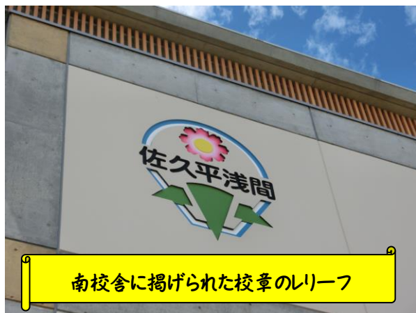
南校舎に掲げられた校章のレリーフ