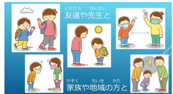
ともだち せんせい 友達や先生と