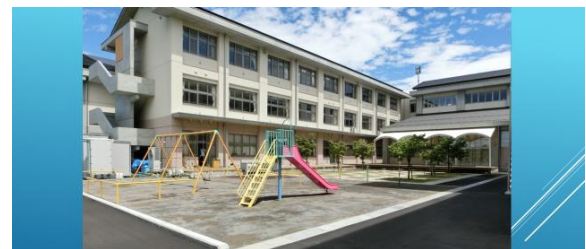
なかにわ つか 中庭が使えるようになりました

また、人間関係をよくするためには「相手を認めること」と「相手を大事にすること」がとても大切ですが、普段から大事にすることとして「挨拶名人」を目指して2学期は頑張してほしいと思います。挨拶の「挨拶」は「自分の心を開く」という意味です。「拶」は「相手の思いを引き出す」という意味です。2学期は「清掃名人」と「挨拶名人」の2つを目指して全校で取り組みましょう。そして、新型コロナウイルスの感染予防もみんなで取り組み、実り多い2学期にしていきたいと思います。