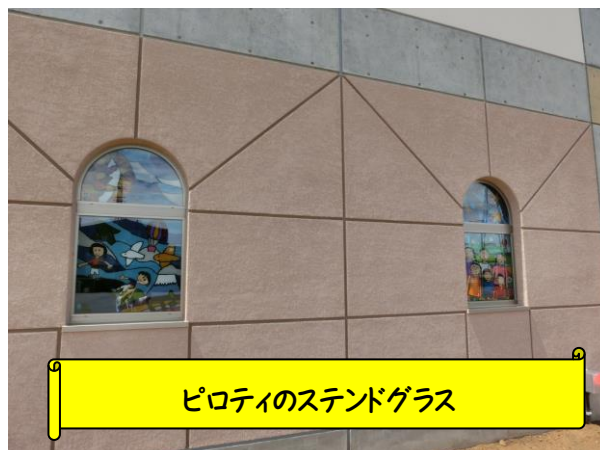
ピロティのステンドグラス