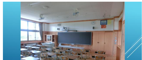
あたら きょうしつ すこれ べる あっ ぶ 新しい教室は少しレベルアップ