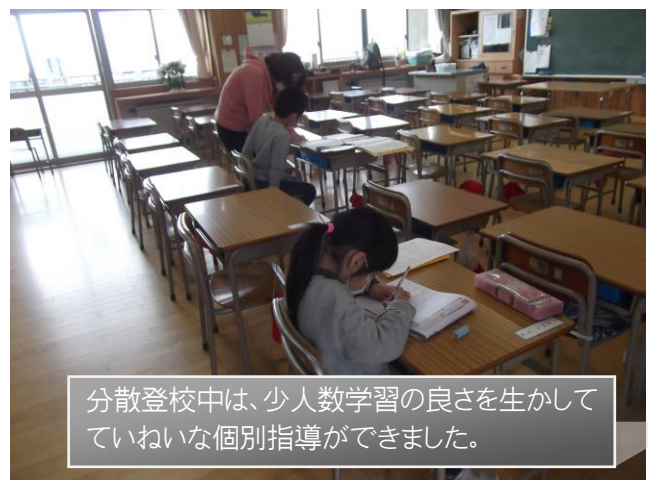
分散登校中は、少人数学習の良さを生かしていいねいな個別指導ができました。