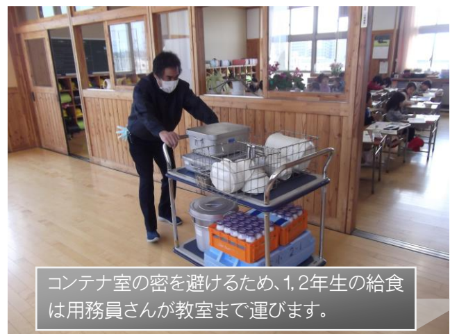
コンテナ室の密を避けるため、1,2年生の給食は用務員さんが教室まで運びます。