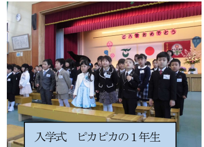
入学式 ピカピカの1年生

4月は、交通安全教室や避難訓練、集団登下校など、安全な生活についての確認をたくさん行いました。「自分の命は自分で守る」ことが大前提ですが、児童が安全に過ごせますよう、今年度も、「保護者の皆さま」、「見守り隊」や「子どもを守る安心の家」をはじめとする地域の皆さまのお力をお借りいたします。よろしくお願いいたします。