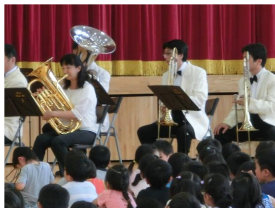
音楽鑑賞教室 ブラスバンドの音色に感激