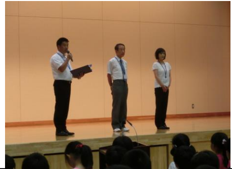
2学期より2名の先生が仲間入り 始業式の前に紹介式を行いました

2学期もPTAの方々や地域の皆様のご協力をいただきながら、子どもたちの成長のために学習活動を行います。1学期同様にご支援ご協力をお願いします。